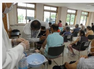
早く流行が終息することを願います