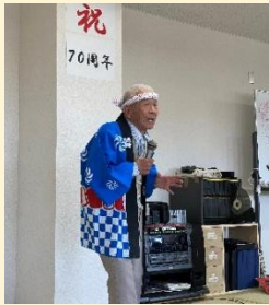
70周年を祝ってカラオケ大会を催しました