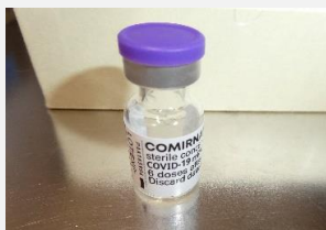
コロナウイルスワクチン接種を行いました