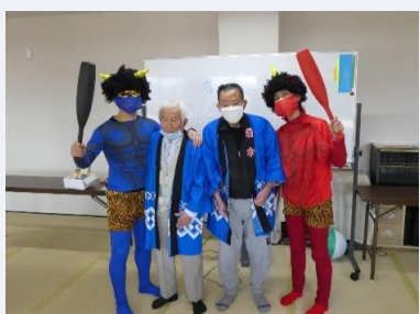
年男が赤鬼・青鬼とパチリ！