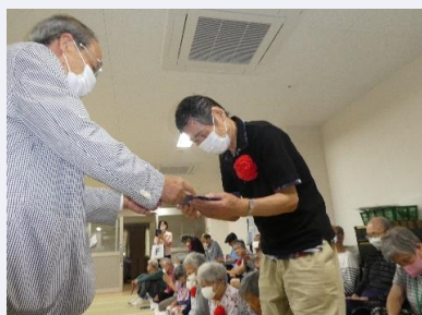
一人ずつ、記念品を受け取ります