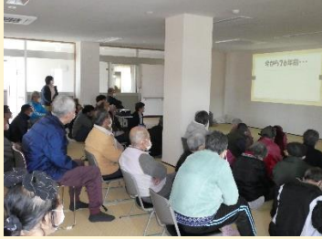
広風園のあゆみをスライドで紹介します