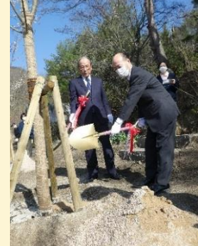
桜の木を植樹しました