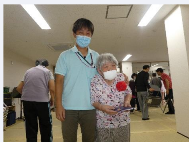
最年長者は88歳 まだまだお元気です