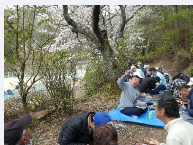
例年より距離を開けて黙食です